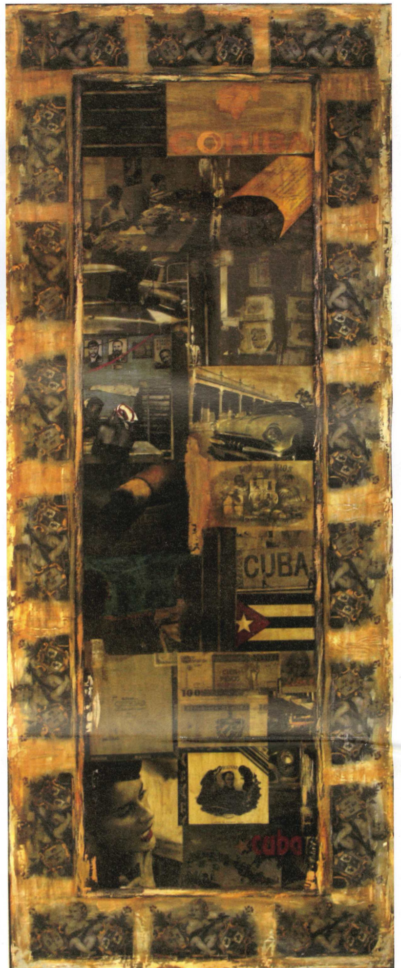
Habanos | 200 x 80 cm

Die Arbeiten der beiden Künstler faszinieren mit markanten Materialmischen: Holz, Papier und Lacke werden mit den für Fuchs typischen, plastischen Wachs-Elementen zu beeindruckenden Kunstwerken. Sie animieren zum tief-sinnigen Hinsehen ... ziehen Blicke magisch an und vermitteln tief-sinnige Botschaften.