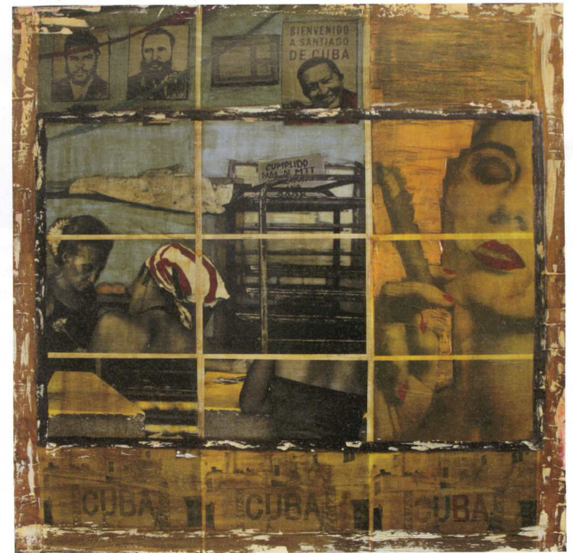
Bäckerei | 100 x 100 cm | Lack, Acryl, Papier auf Leinwand | 2010